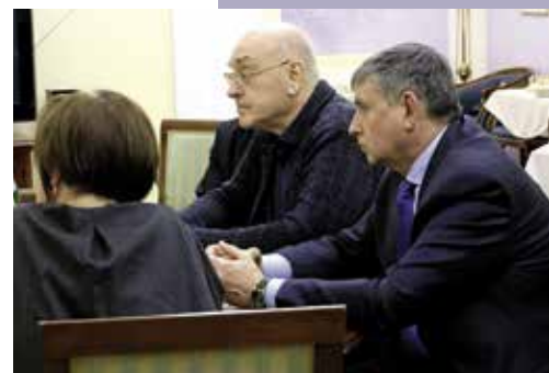
На круглом столе в Свердловской филармонии