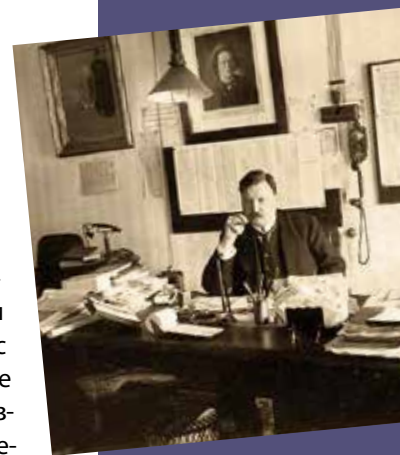
А. К. Глазунов в своем кабинете в Петербургской консерватории (1912)