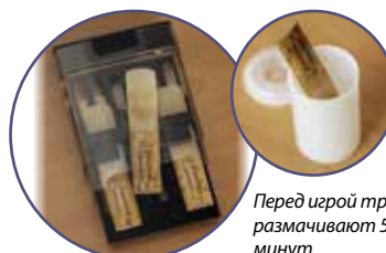
Перед игрой трость размачивают 5–10 минут

Внешняя схожесть с «чубуком» (курительной трубкой) не только для того, чтобы инструмент был более компактным: форма параболического конуса, найденная Саксом, и тонко изученные им принципы акустических соотношений являются источником неповторимого тембра саксофона