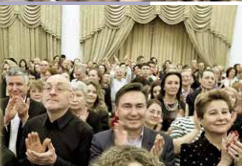
На концертах в филармонии