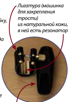
Лигатура (машинка для закрепления трости) из натуральной кожи, в ней есть резонатор

На эс есть элемент, связанный с октавным клапаном, расположенным на инструменте, при его открытии звучание становится на октаву выше