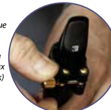
Сверху надевается лигатура и закручивается винтом, между тростью и мундштуком образуется щель, в которую задувается воздух