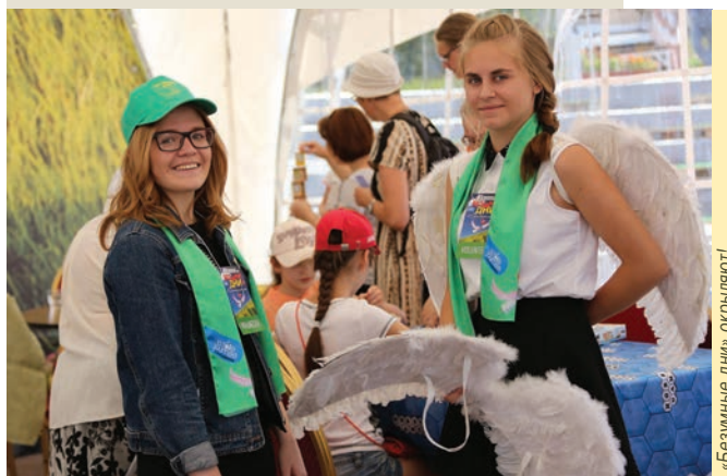
«Безумные дни» открывают!

Волонтеры филармонии – это друзья и добровольные помощники, которые безвозмездно отдают свое время, труд и энергию для ее процветания.