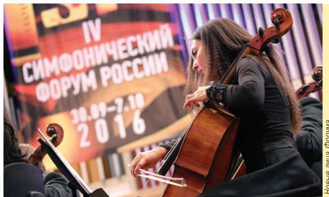
Новые лица Форума

Семинар для менеджеров концертных организаций и симфонических коллективов (25 регионов) Повестка: мониторинг деятельности за 2015 год, обсуждение вопросов о категоричности оркестров и создания Положения о творческих коллективах, продюсирование оркестров и их жизнь в современном информационном пространстве