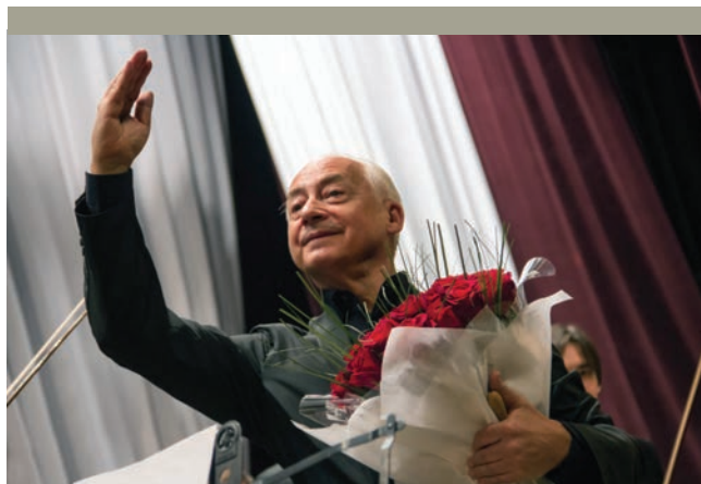
Владимир Спиваков в Каменске-Уральском

В 2016 году в Региональном концертном зале состоялись 5 концертов, которые, наряду с публикой Ирбита, посетили члены Филармонических собраний – свыше 500 человек, представляющих 14 населенных пунктов области.