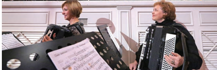
Когда сцены не хватает... Открытие 81-го сезона

Июль. «Безумные дни в Екатеринбурге»: 94 концерта на 8 площадках для 26 000 слушателей – рекордные цифры для уральской столицы.