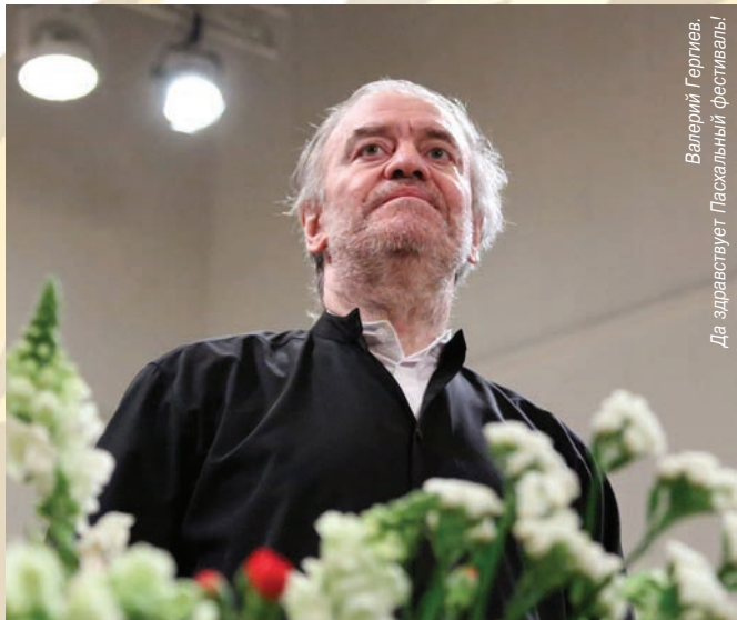
Валерий Гергиев. Да здравствует Пасхальный фестиваль!