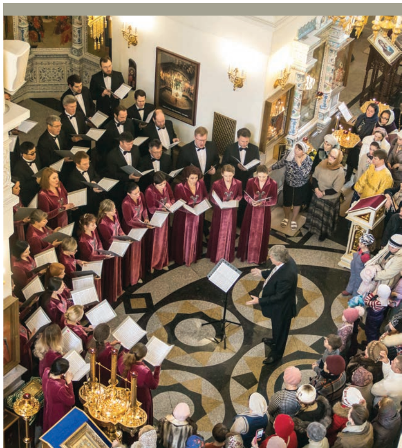
Литургия Чайковского в храме «Большой Златоуст»

КУЛЬТУРНО-ПРОСВЕТИТЕЛЬСКАЯ АКЦИЯ «ДЕНЬ МУЗЫКИ ЧАЙКОВСКОГО В СВЕРДЛОВСКОЙ ОБЛАСТИ» 6 ноября