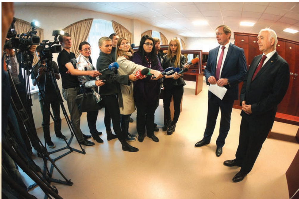
Главные культурные новости здесь!