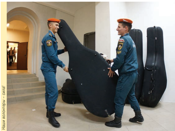
Наши волонтеры – сила!