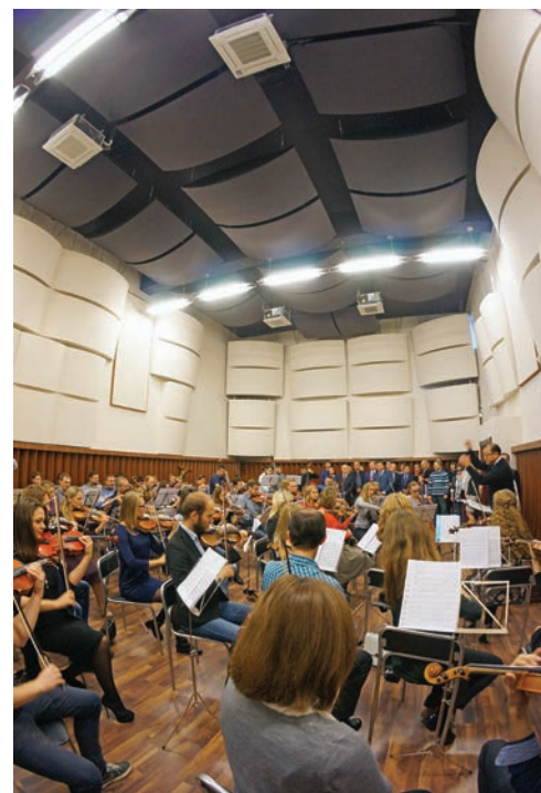
Молодежный оркестр, с новосельем!