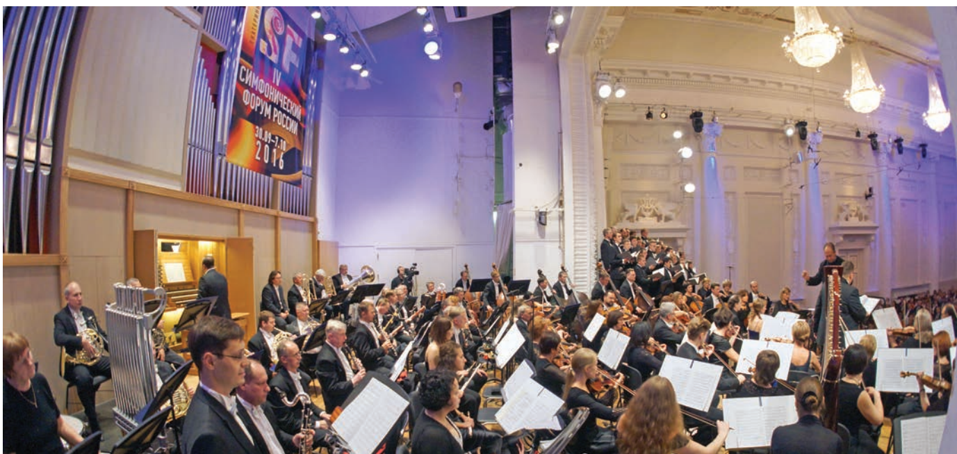
Открытие Симфонического форума России

Главная идея – «Место встречи российских оркестров»