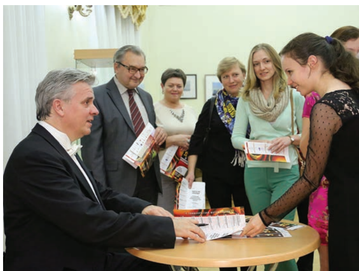
Автограф маэстро Бермана