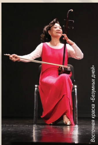
Восточная краска «Безумных дней»