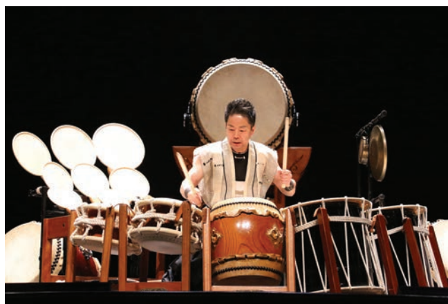
Ударные «Безумные дни»

Тексты: С. Абушик, Н. Чернега