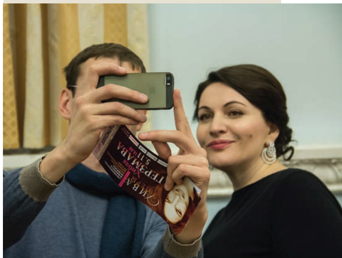
Звезды становятся ближе

Лига друзей объединяет людей, вовлеченных в филармоническую жизнь. Это слушатели, посещающие филармонические залы Екатеринбурга и области, а также члены Филармонических собраний, которые смотрят трансляции концертов Виртуального концертного зала и пропагандируют классическое искусство.