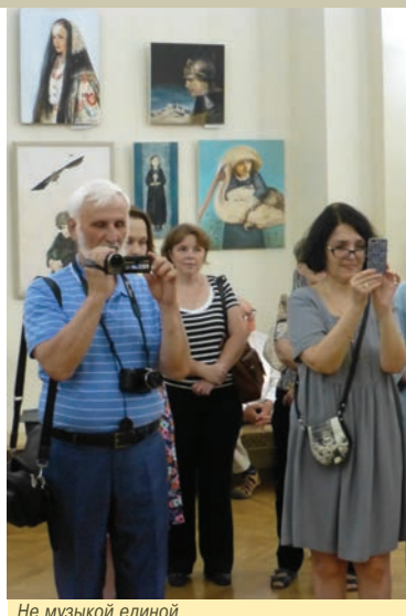
Не музыкой единой

Всего в 2016 году состоялось 19 выставок.