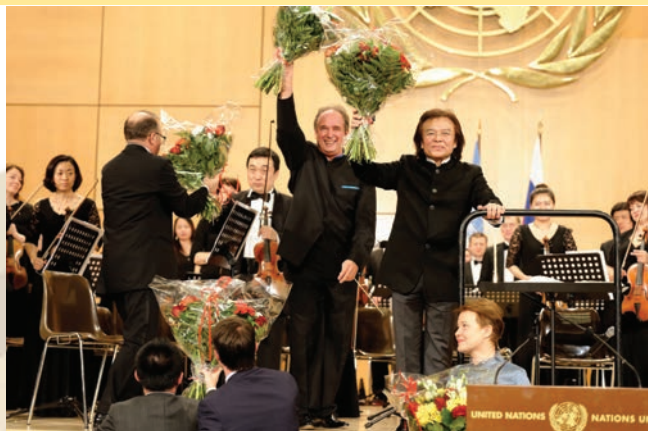
Музыка объединяет: концерт в ООН