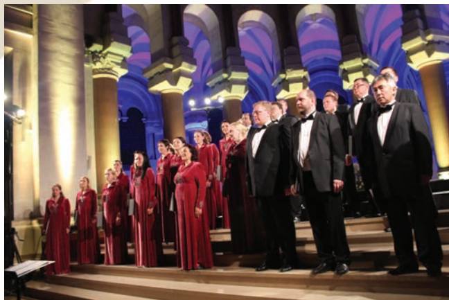
Симфонический хор покоряет Европу