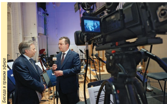
Беседа в прямом эфире