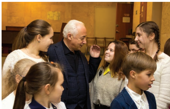
Запомните эти мгновения!