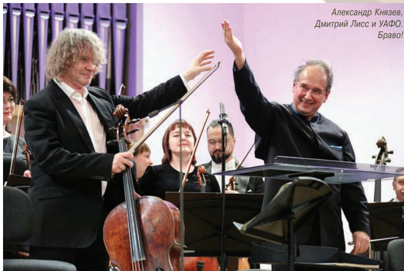
Дива оперы Хибла Герзмава