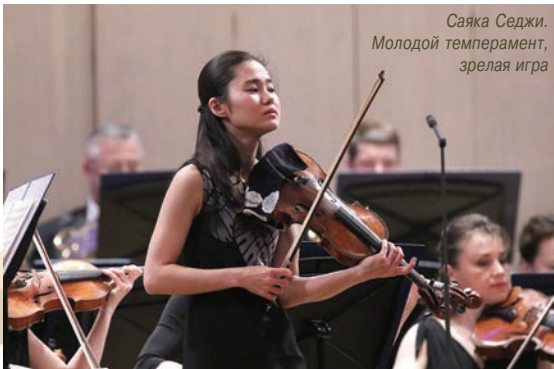
«Звезда XXI века» Айлен Пригичин