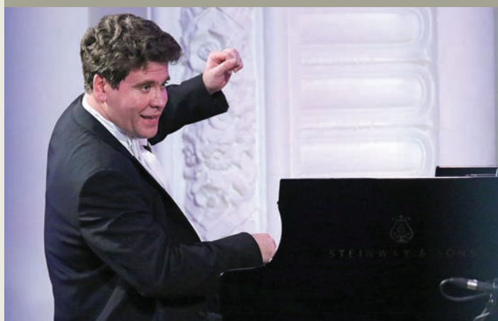
Повелитель роялей Денис Мацуев

Главные концерты VI Международного конкурса пианистов памяти Веры Лотар-Шевченко объединили членов жюри и лауреатов, которые играли соло и в сопровождении Уральского филармонического оркестра.