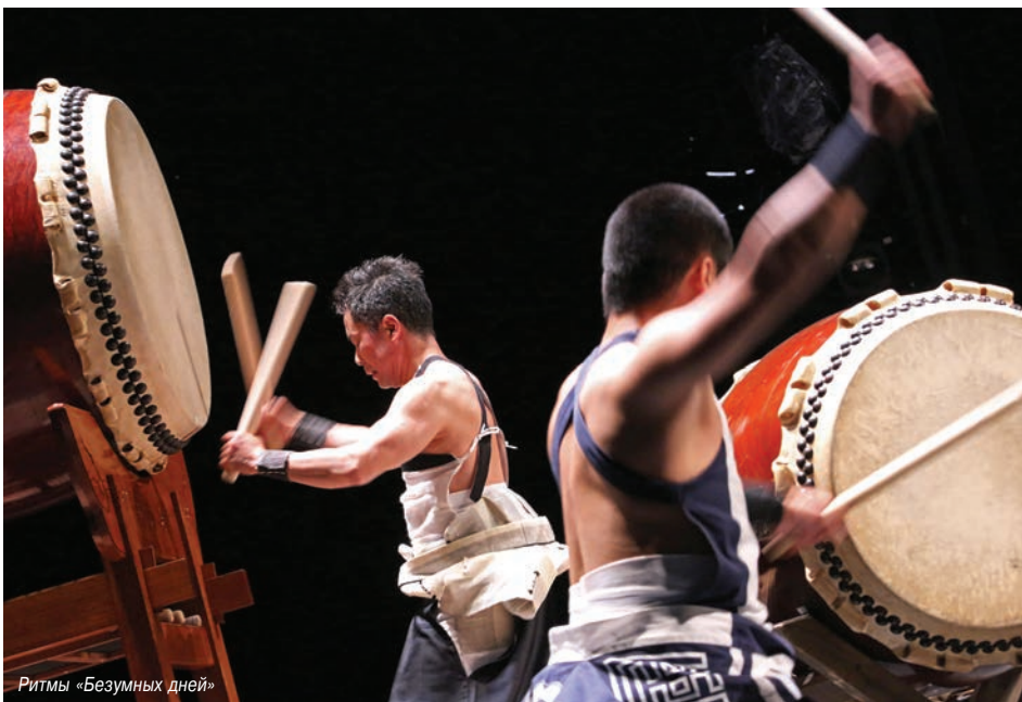
Ритмы «Безумных дней»