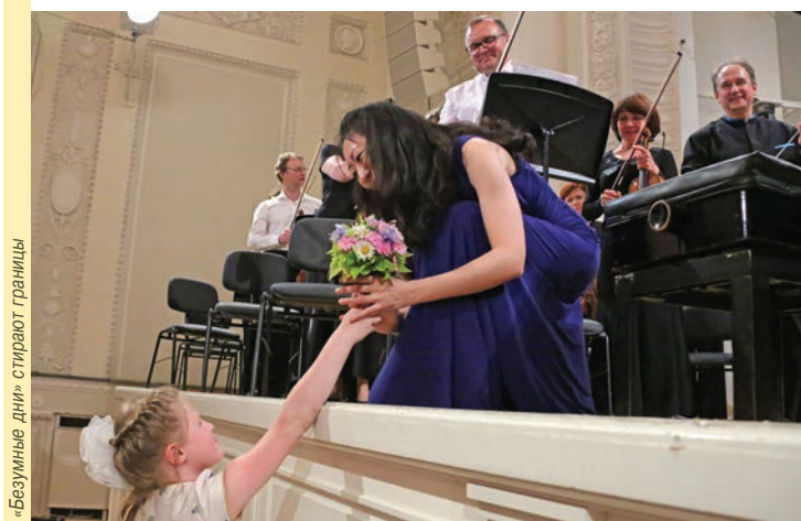
«Безумные дни» стирают границы