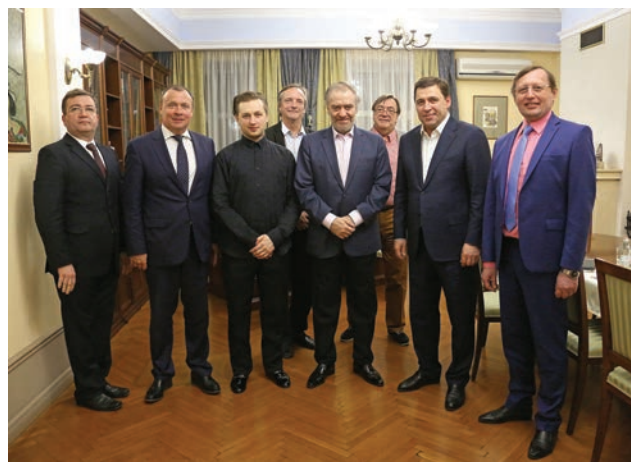
Друзья, попечители, партнеры