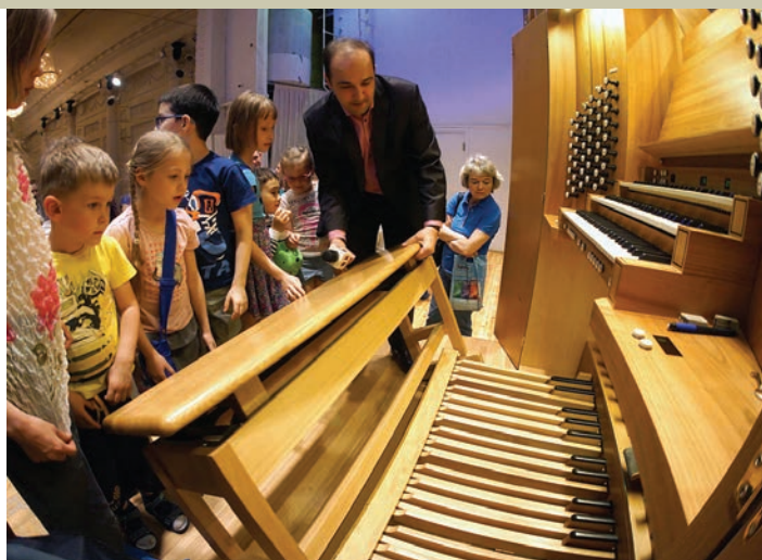
Так вот он какой, король инструментов!

Новые экспонаты – «съемочная площадка» Виртуального концертного зала, кинопоказ под «живую» музыку, интерактивная презентация фестиваля «Безумные дни» и самый большой музыкальный инструмент – орган.