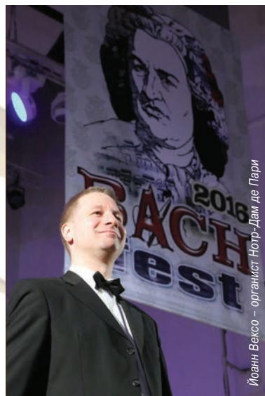
Йоханн Вексо – органист Нотр-Дам де Пари