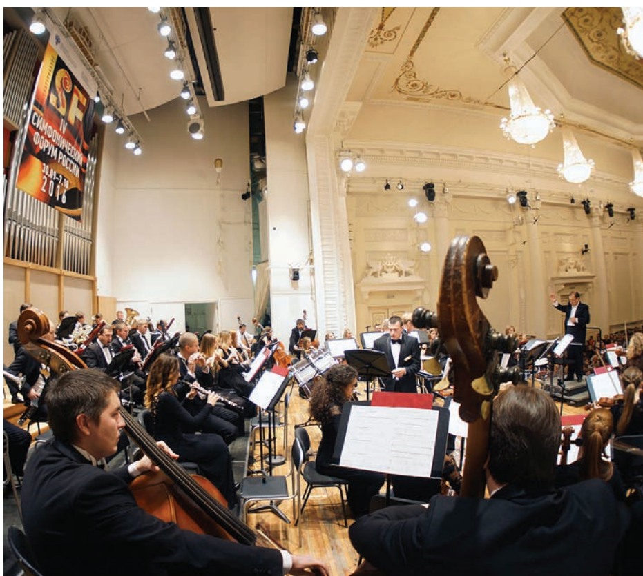
Маэстро Энхэ и Молодежный оркестр – 10 лет вместе