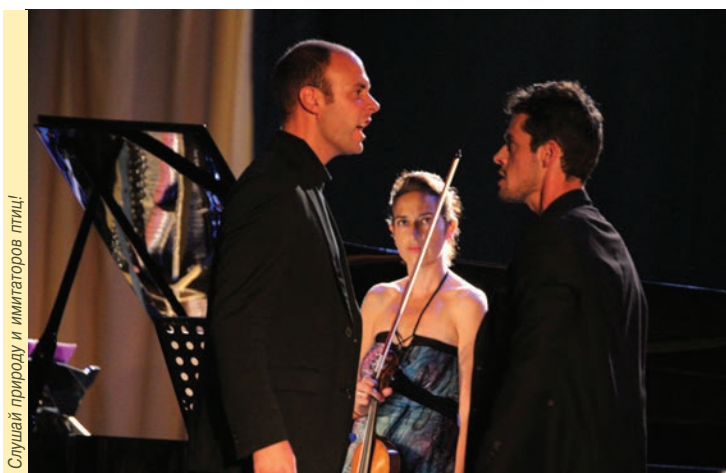
Слушай природу и имитаторов птиц!