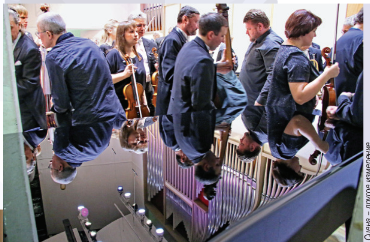
Сцена – другое измерение

It is one of the leading orchestras in Russia. It was founded in 1936. Each season the orchestra offers more than 70 programs to the audience and gives about 100 concerts. It has given guest performances in 17 countries worldwide. It spearheads major culture projects. The orchestra takes part in prestigious international festivals (including Beethovenfest, La Folle Journee). It has recorded about 20 CDs; some of them were made to the order of Warner Classics International and Mirare. The orchestra works with the leading conductors and soloists from all over the world. It prides itself on its excellent musical instruments. The general management of the orchestra around the world is held by the agency «Les Productions Internationales Albert Sarfati» (France).