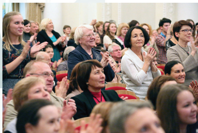
Консерватория – филармония: браво!