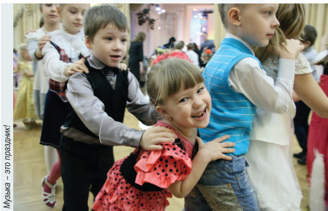
Музыка – это праздник!