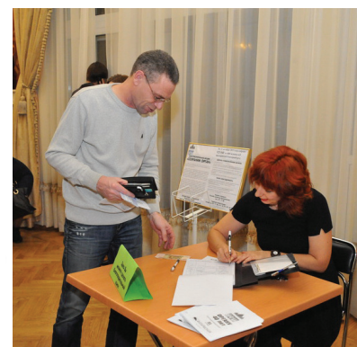
Искусство требует пожертвований