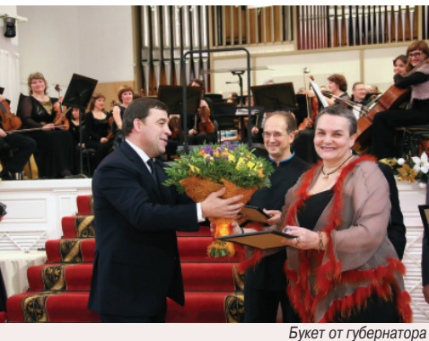
Букет от губернатора