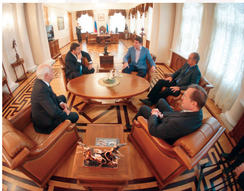
Рыцари круглого стола. Встреча у губернатора