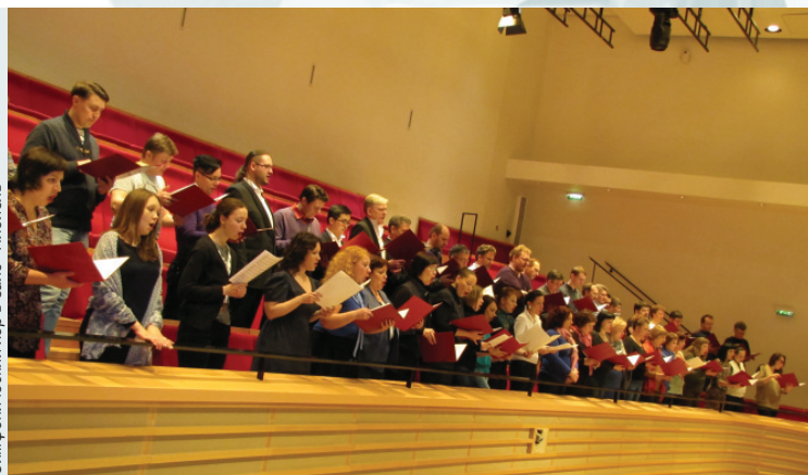
Симфонический хор в зале «Плейель»