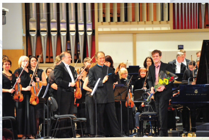
Бенджамин Гроссвенор – впервые в России