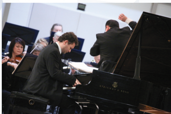
«Звезды XXI века»: Юрий Фаворин