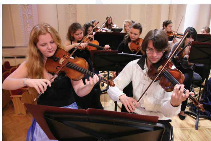
Юрий Башмет представляет!