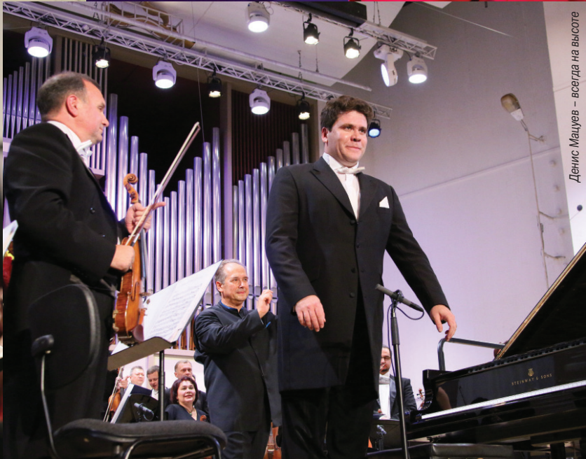
Денис Мацуев – всегда на высоте