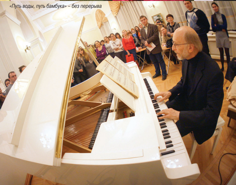
Ударная сила Гонконгского оркестра