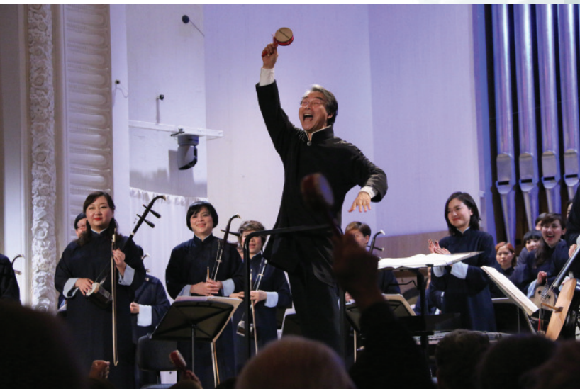
Тот, кто управляет залом, владеет музыкой