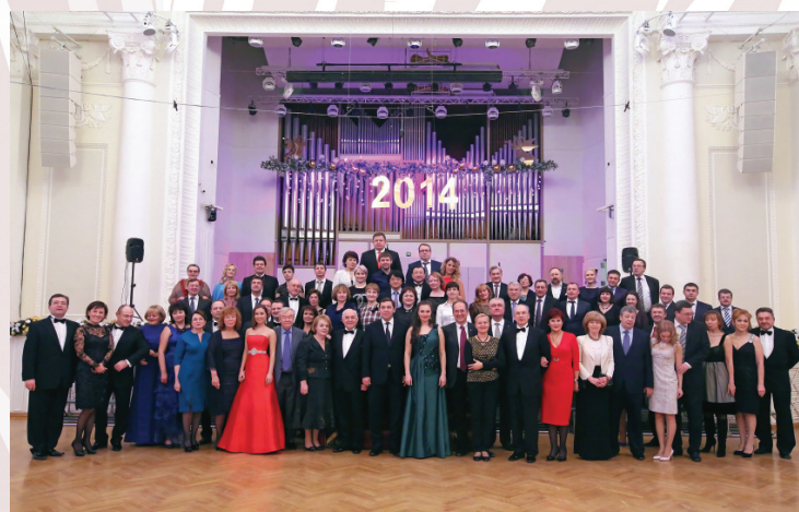
Гости Губернаторского бала