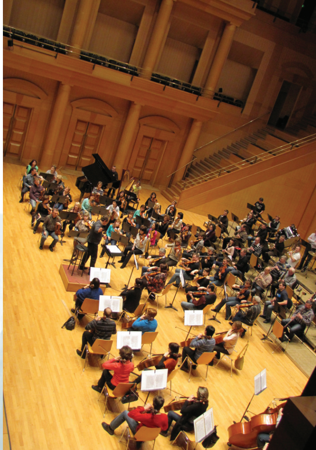
УАФО в Меце