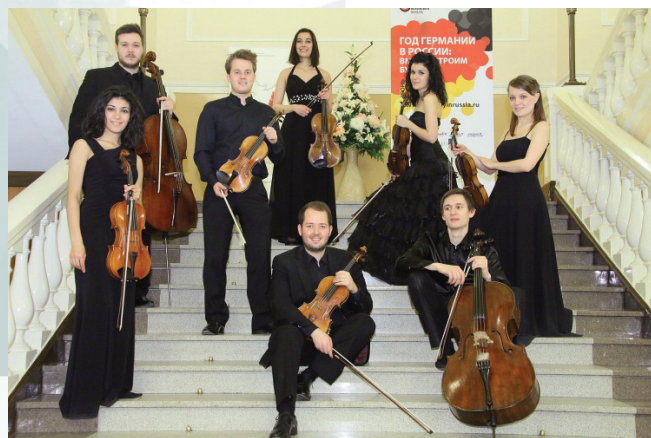
Ансамбль «2012». Россия-Германия