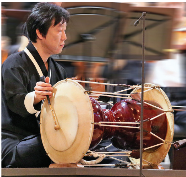
Звездный час чанггу. Впервые в истории – соло с оркестром

Фуррер-Мюнх Ф. «Альбом с зарисовками» для ансамбля. Ансамбль «Phoenix Basel» / Ю. Хенненбергер. 28 ноября