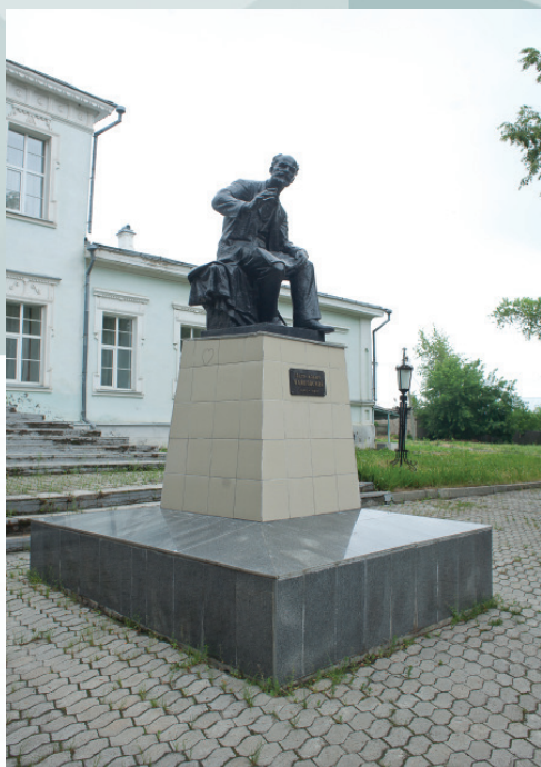
Чайковский – ближе, чем ты думаешь