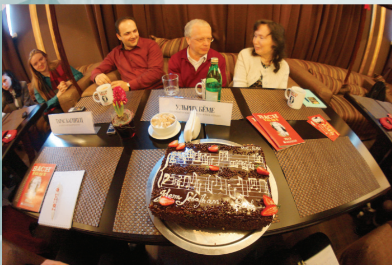
Вкус хорошей «Шутки» Баха