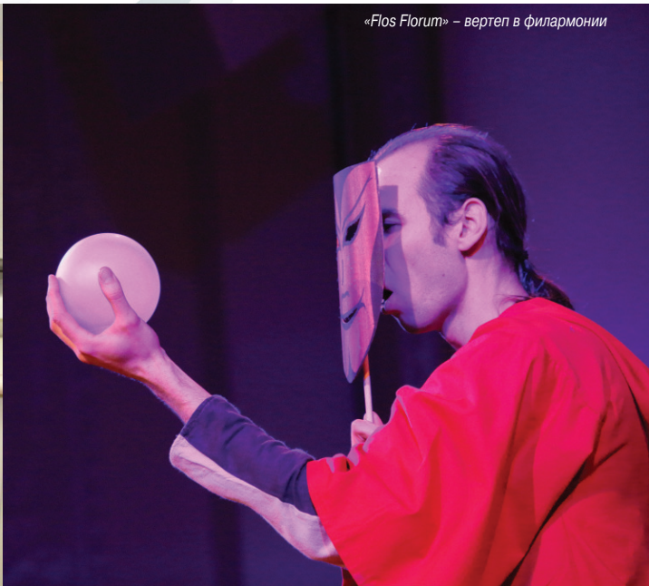
«Flos Florum» – вертеп в филармонии