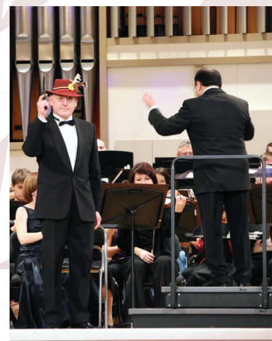
На сцене с УАФО. Мечта Бриля