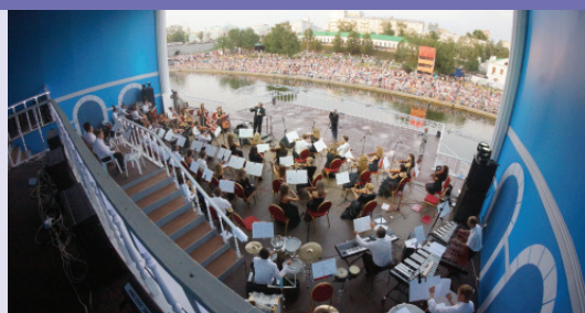
Мировая классика в Историческом сквере