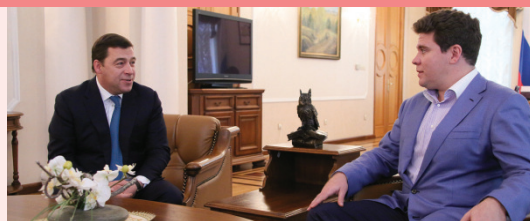
Разговор об УАФО