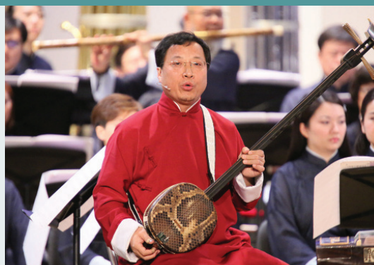
Открытие фестиваля «Евразия»