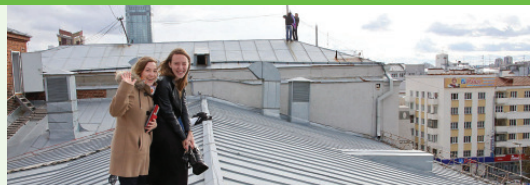
Филармония без границ