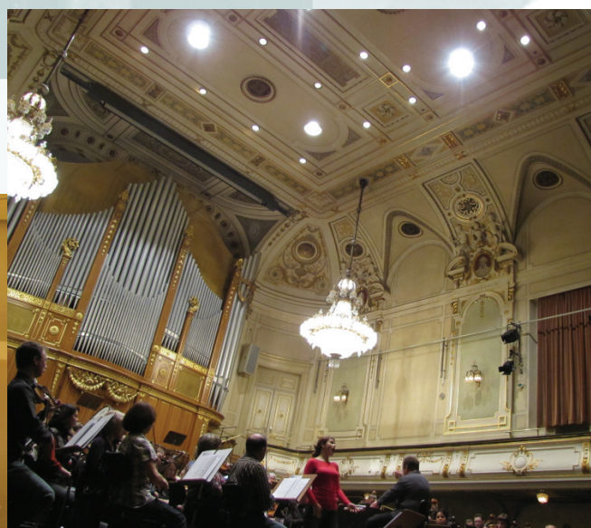
Репетиция с Ольгой Перетятко. Грац, Австрия

November. The beginning of the second season of subscription concert series of the UPO in the Mariinsky Theater (St. Petersburg).