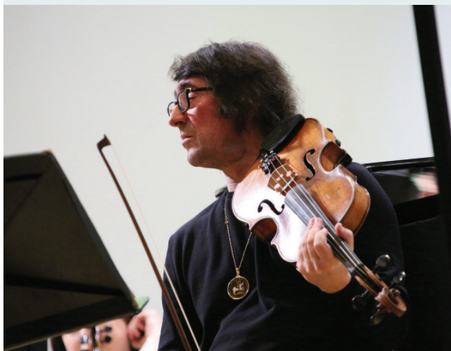
Юрий Башмет – всегда желанный гость

Заречный – Всероссийский юношеский симфонический оркестр. Основатель, художественный руководитель и главный дирижер – Юрий Башмет.