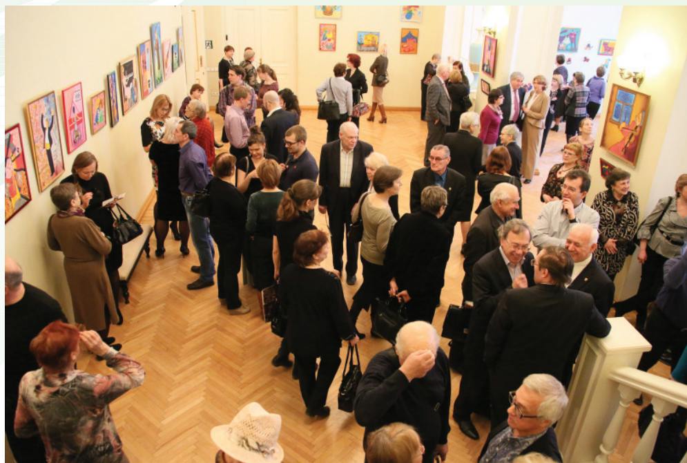
Место встречи – Малое фойе

Галерея «Эгида» создана в 2001 году для посетителей концертных залов филармонии. В 2013 году состоялась 16 выставок. Среди них проекты известных екатеринбургских художников, а также молодых авторов, впервые представивших свои работы.