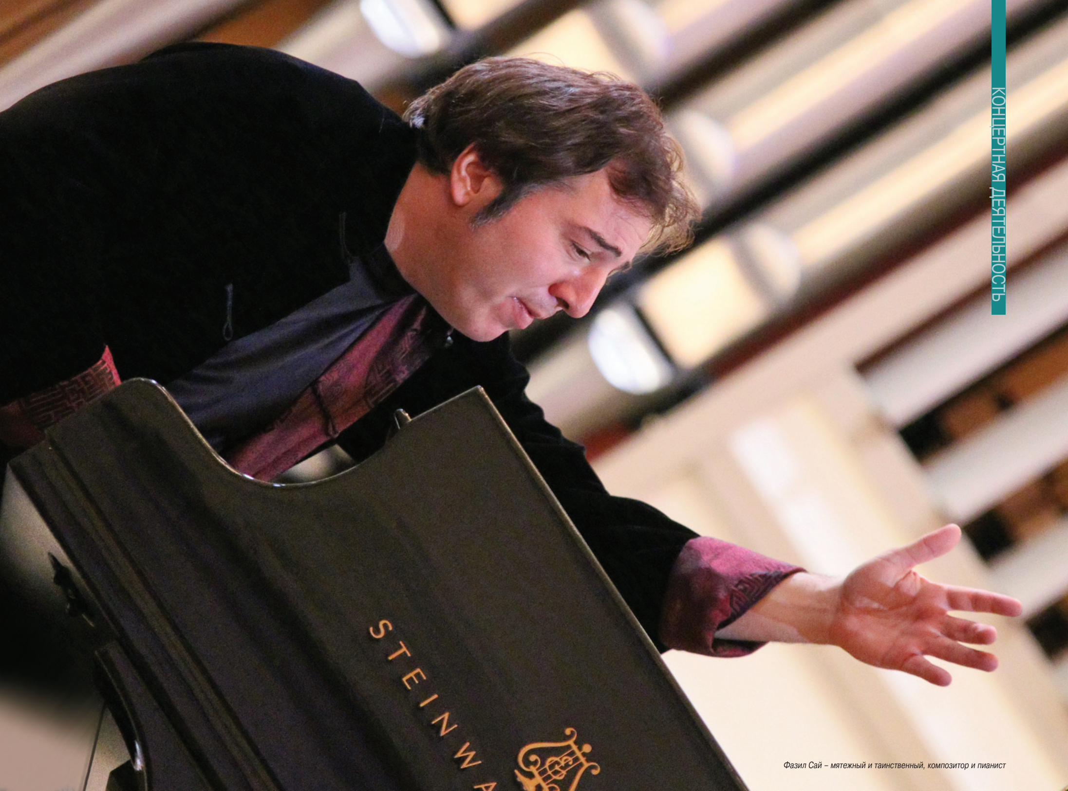
Фазил Сай – мятежный и таинственный, композитор и пианист