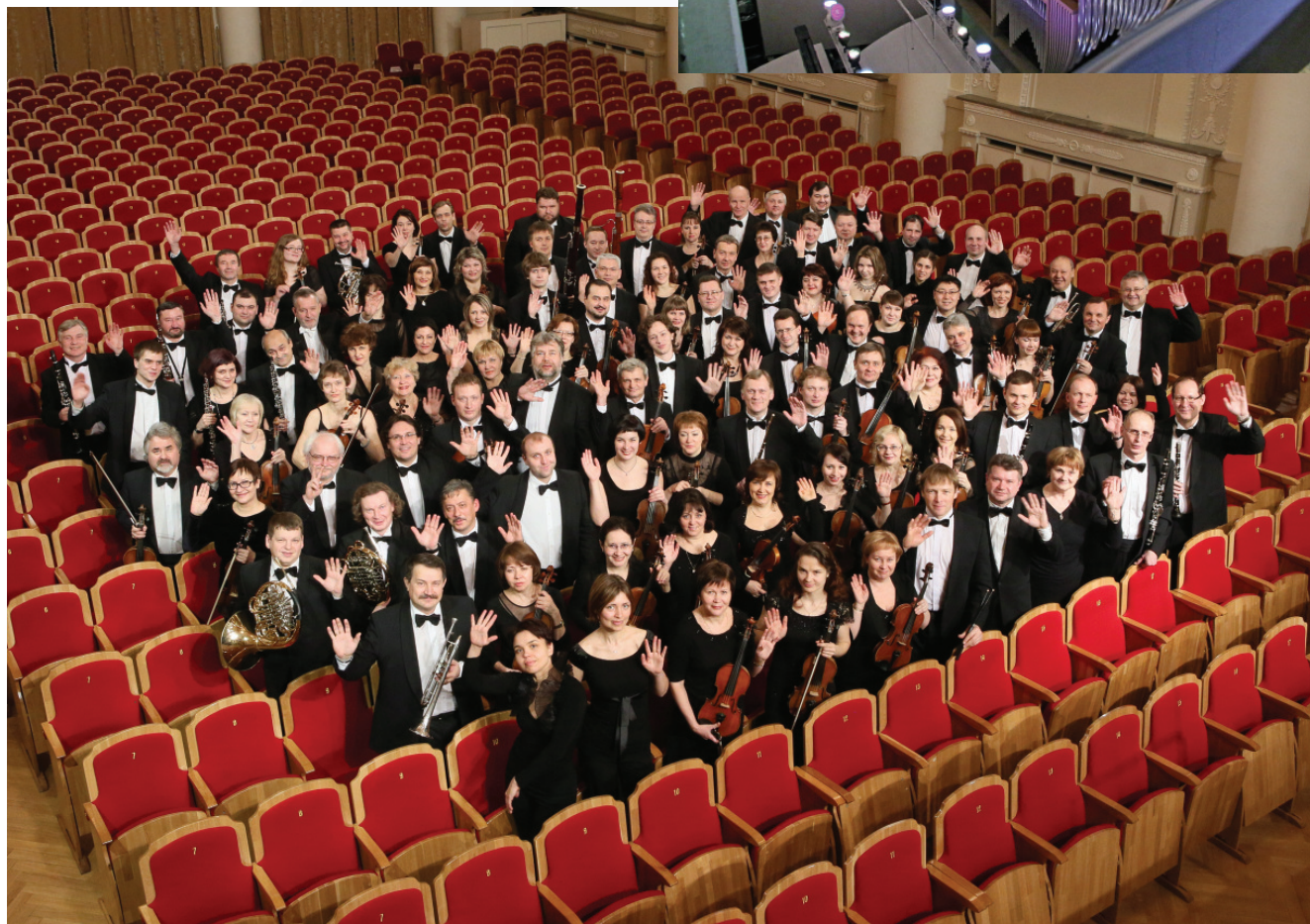
УАФО в своем зале

В течение 2013 года для УАФО были приобретены следующие музыкальные инструменты зарубежных производителей: