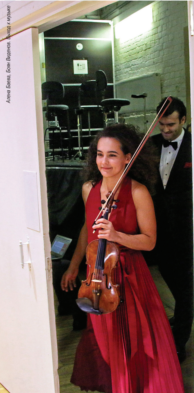
Гидон Кремер – 20 лет спустя