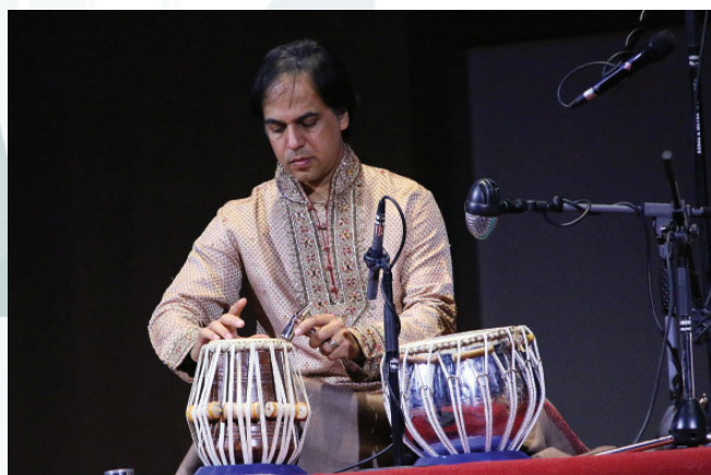
Шелковый путь: индийские раги