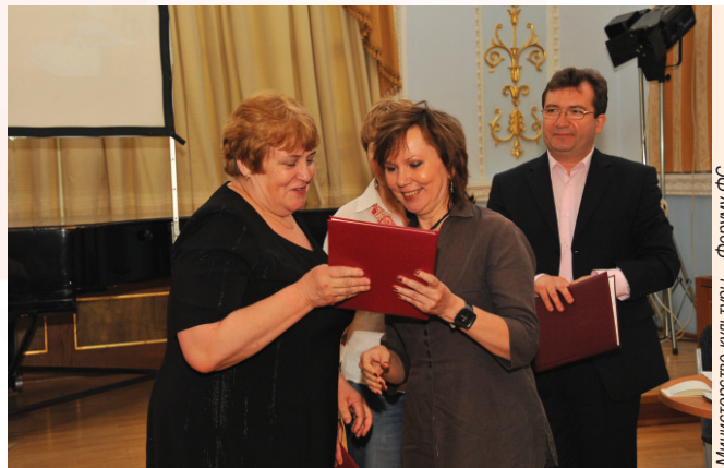
Министерство культуры – Форуму ФС