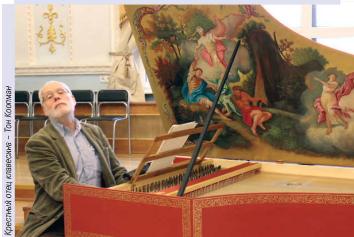
Крестный отец клавесина – Тон Коопман

Презентовал клавесин известный специалист в области барочной музыки, художественный руководитель Амстердамского барочного оркестра Тон Коопман (Нидерланды) в рамках II Международного музыкального фестиваля «Евразия».