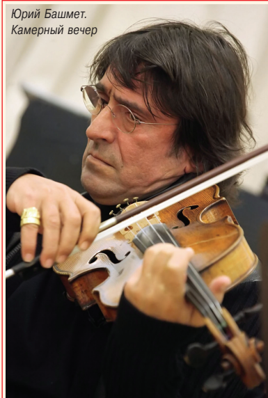
Юрий Башмет. Камерный вечер