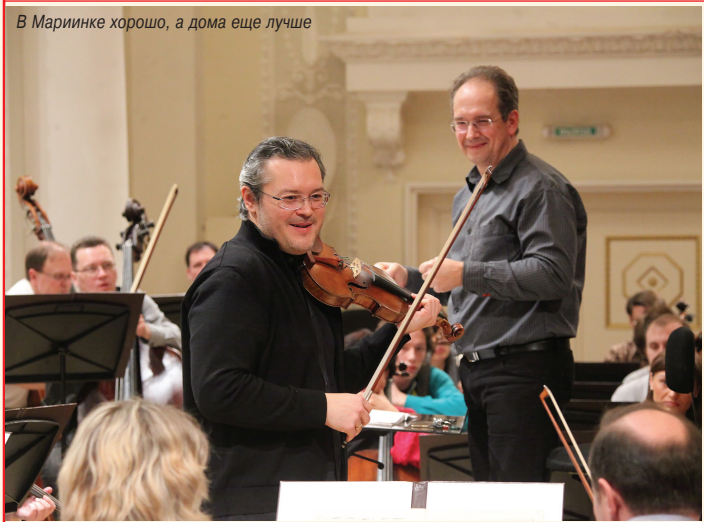
В Мариинке хорошо, а дома еще лучше