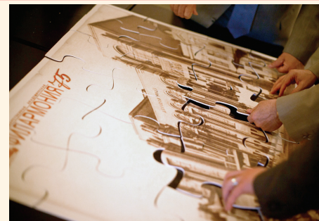
Филармония – своими руками