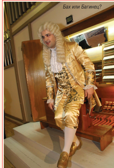
Бах или Багинец?