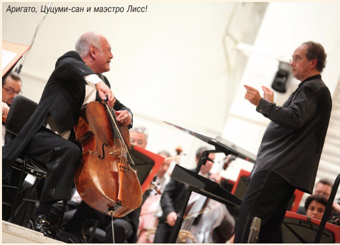
Титаны пианизма. Борис Березовский, Александр Гиндин