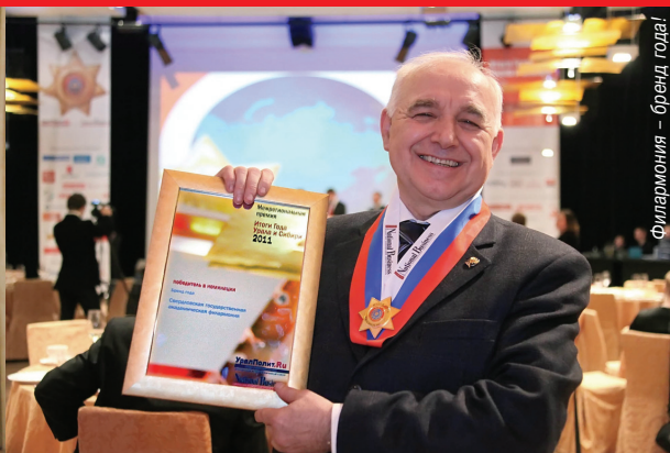
Филармония – Бренд года!

СВЕРДЛОВСКАЯ ГОСУДАРСТВЕННАЯ АКАДЕМИЧЕСКАЯ ФИЛАРМОНИЯ 75