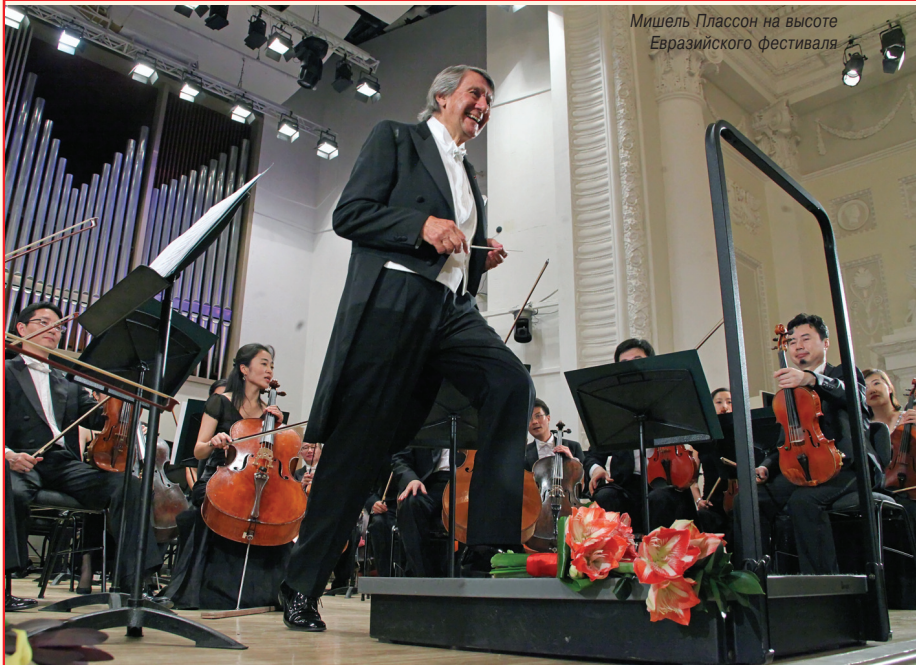
Мишель Плассон на высоте Евразийского фестиваля