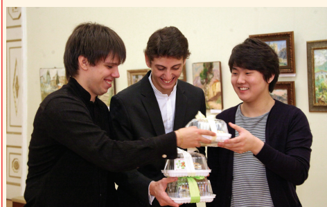
Пирог – лауреатам!