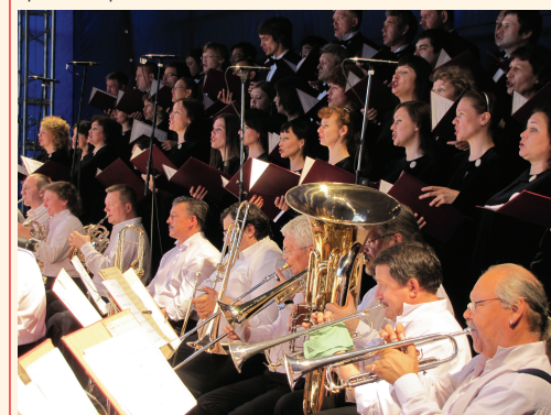
Симфонический хор – с оркестром и сольными программами