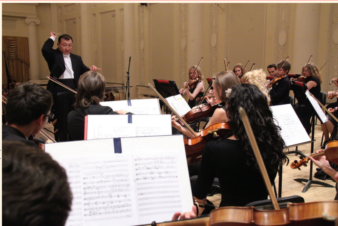
УМСО + Эпиз = 2 фирменных абонеента