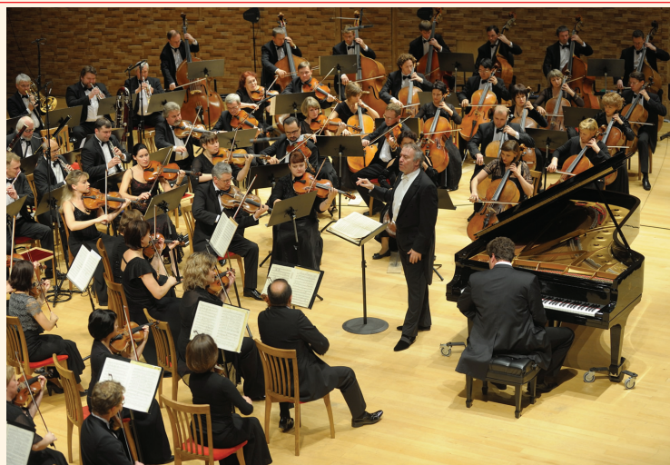
Валерий Гергиев за пультом УАФО