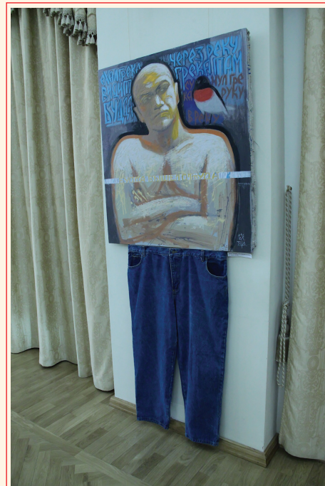
«100 портретов» начались с «Автопортрета»

Уральская ассоциация художников по куклам. Традиционная рождественская выставка