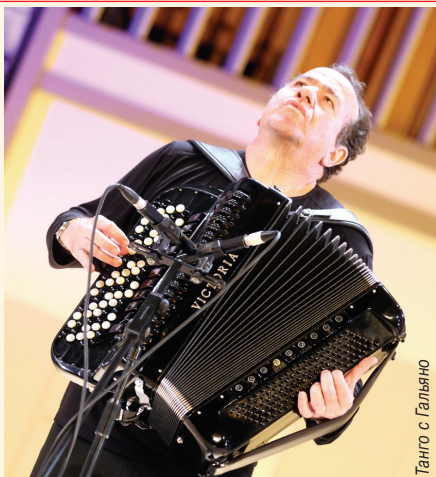
Танго с Гальяно