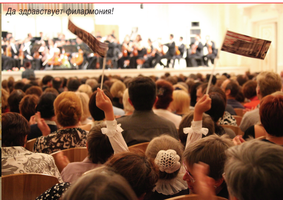
На 1-й странице обложки: Грандиозный Евразийский фестиваль состоялся!