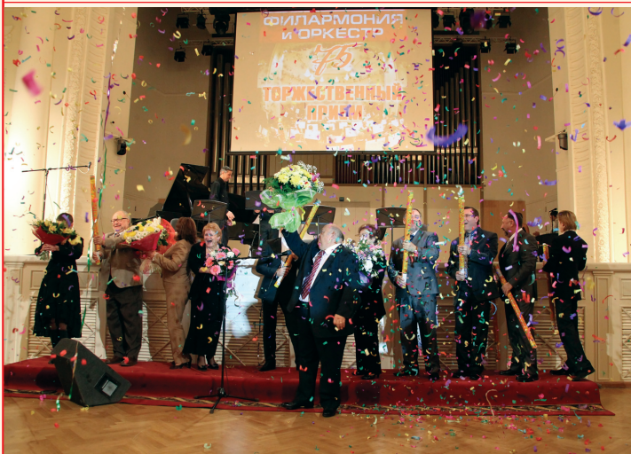
Салют филармонии и оркестру!