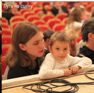
Путь на сцену