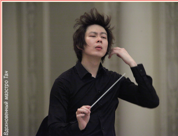
Вдохновенный маэстро Тан