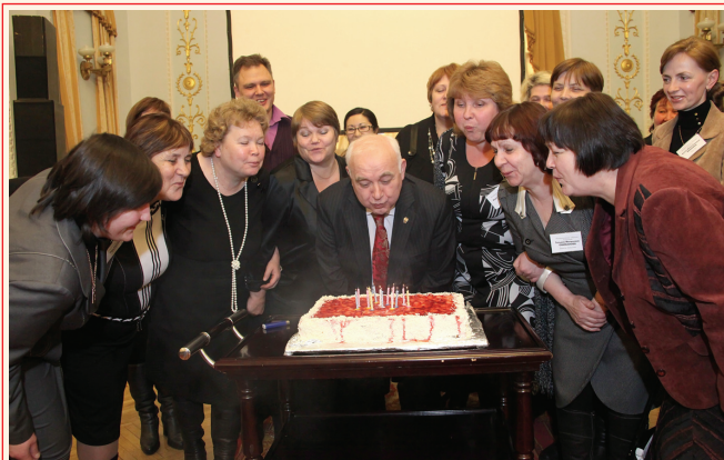
Праздник Филармонических собраний

Партнеры – муниципальные библиотеки Свердловской области. Концерты проходят в читальных залах библиотек, где проложены линии доступа в Интернет, установлены видеопроекторы и звуковые системы.